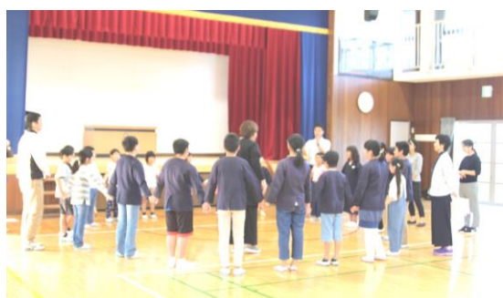
【全校園合唱の練習】

10月27日（日）の学習発表会に向けて幼稚園・各学年で子どもたちは練習に励んでいます。この1年間で成長した子どもたちの姿をぜひご覧下さい。