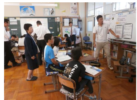
【5・6年生 社会科授業】

10月10日(火)に香美町教育長様をはじめ、町教育委員会の皆様に学校訪問においでいただきました。幼稚園での「食」を中心にした取組や小学校での複数教師による少人数授業、また交流学习などを紹介しました。授業参観ではそれぞれの学年での子どもたちの学習の様子をご覧いただきました。その後の懇談会では「子どもたちが主体的で意欲的に学習に取り組んでいる」との高い評価をいただきました。今後も少人数の特色を活かした教育活動に努めていきます。