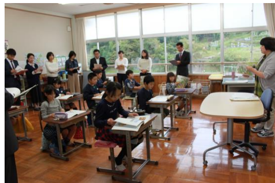
【3・4年生 人権学習公開】

10月18日(水)に香美町人権教育研究協議会の学校部会授業研究会が行われ、町内の先生方に3・4年生の授業公開を行いました。授業では「やくそくげんまん」出典：『ほほえみ3・4年』を使い、「人の言動に引きずられず、自分が正しいと考えたことにしたがって行動することの大切さに気づかせる」ことをねらいとしました。子どもたちは少し緊張気味でしたが、よく発表し友だちの意見を聞く中で自分の考えを深めていくことができました。これからも、実際に行動する力に結び付けていきます。