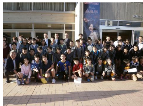
【市民会館前で記念写真】

10月9日(月)に豊岡市民会館で開催された「国際ソロプチミスト但馬認証20周年記念チャリティーコンサート 森麻季ソプラノ リサイタル」に国際ソロプチミスト但馬様のご厚意により香住区内の小学生が招待していただきました。本校からも5・6年生の希望者が参加しました。コンサートでは歌劇の曲や「赤とんぼ」などの童謡も聴くことができ、楽しい時間を過ごすことができました。