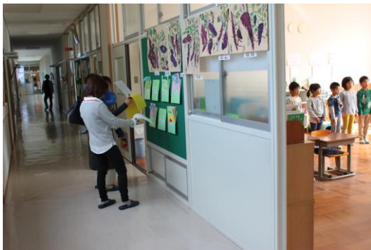
【授業の様子や作品をご覧いただきました】

さて、兵庫県下のすべての学校で行われるオープンスクールは学校と家庭、地域が連携して子どもたちを育てていくためのものです。今後も本校の取組をご理解いただき、子どもたちの生きる力を育むためにご支援、ご協力をお願いいたします。お忙しい中、ありがとうございました。