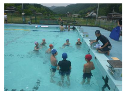
〔佐津小との合同授業〕

プール開きは終わっていたのですが、気温、水温がなかなか上がらずプールが待ち遠しい日が続いていました。待望の水泳です。昨年度より同じ時間に全校児童がプールに入り、全教職員で水泳指導を行っています。今年も3グループに分かれてそれぞれが目標を立てて頑張っています。