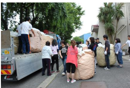
[アルミ缶の積み込み]

6月17日(土)はPTA主催の資源回収を行いました。地域の皆様にもたくさんのアルミニウム缶(405kg)・牛乳パック(125kg)・ビン類(671本)を提供していただき収益金は計29,681円でした。また、町より奨励金をいただきました。PTAで教育諸活動の充実に活用させていただきます。次回は、10月7日(土)の実施の予定です。近づきましたらご案内いたします。ご協力・ご支援をお願いいたします。